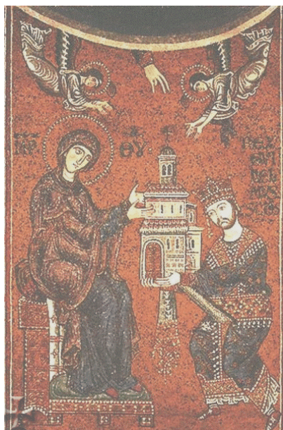
Fig. 4) Guglielmo II offre la Basilica alla Vergine , mosaico, 1180-1189 circa. Monreale, cattedrale, presbiterio.