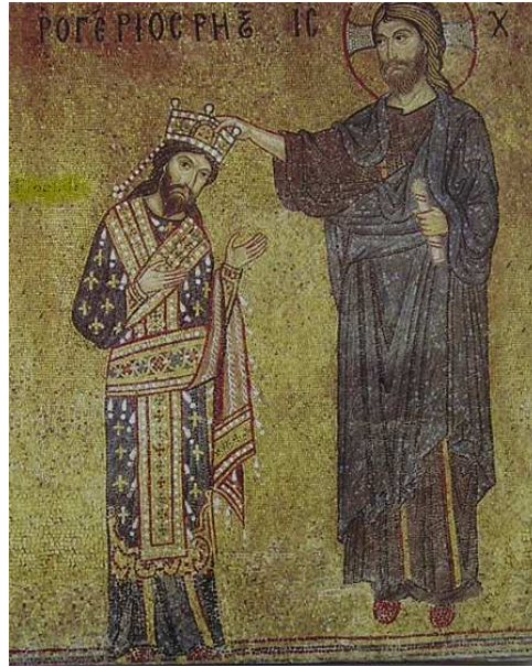
Fig. 7) Ruggero II incoronato da Cristo , mosaico, 1146-1151 circa. Palermo, chiesa di Santa Maria dell' Ammiraglio (detta della Martorana), interno.