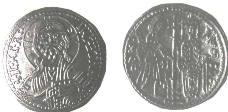
Fig. 2) Ducale di Ruggero II , dritto e rovescio di moneta d'argento, 1140-1154. Napoli, Museo Archeologico Nazionale, Collezione Fiorelli, n. 444.